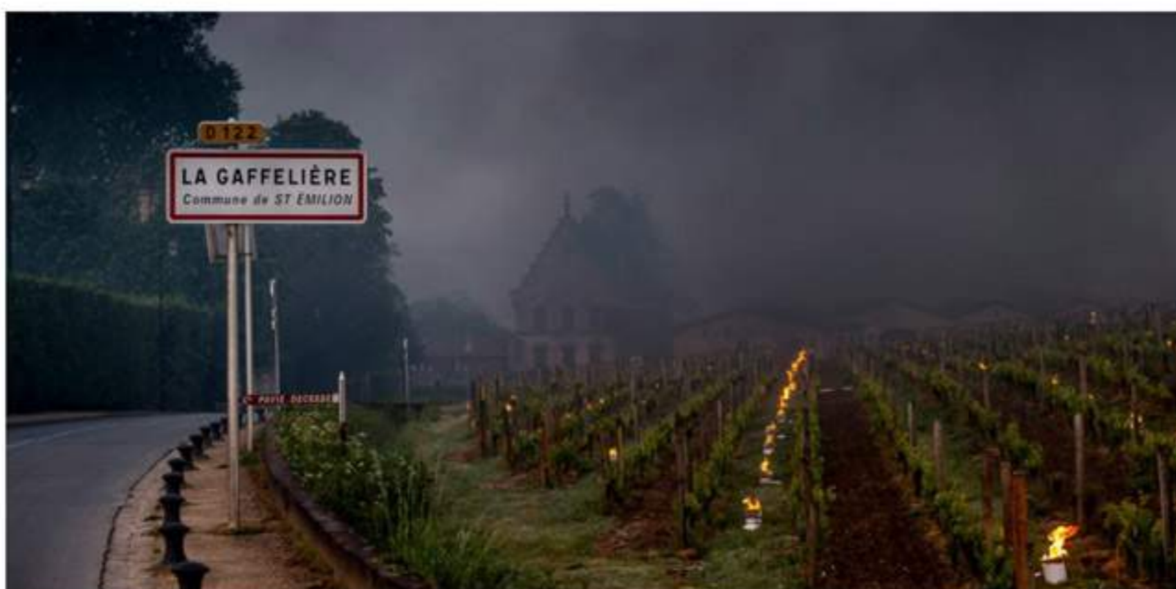
Saint-Emilion en lutte contre le gel du côté du château la Gaffelière fin avril

Côté Châteaux a demandé aux vignerons et acteurs de la filière vin de Bordeaux LA PHRASE qui leur venait à l'esprit pour décrire et résumer l'horreur qu'ils ont vécue, il y a tout juste un an. Le gel, de -3 à -7°C par endroits, a sévi dans quasiment l'ensemble des appellations de Bordeaux. 39% de la récolte a été perdue, la production de vin en 2017 n'est que de 3,5 millions d'hectolitres.