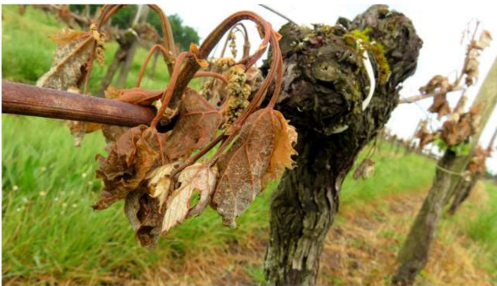
Les dégâts du gel dans le blayais