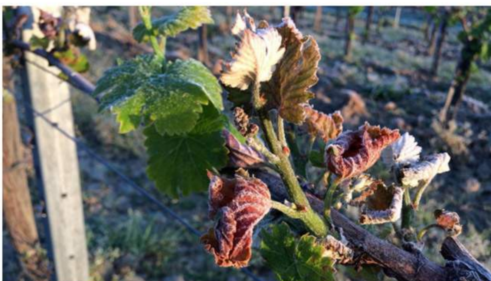
Jeudi 27 avril 2017 au petit matin, une vague de gel intense a considérablement meurtri le vignoble à Bordeaux, comme ici à Moulon