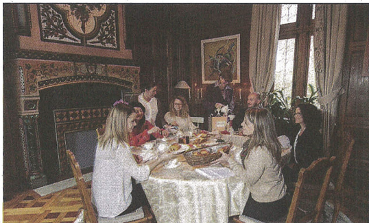
Les salons du château seront ouverts au public.

Le contenant est magnifique, mais quel sera le contenu ? Cinq menus uniques composés de produits de