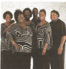
Gospel avec les Ladies of Alabama ce soir à la basilique Saint-Seurin de Bordeaux.

« La nuit du gospel américain ». The Ladies of Alabama & Sjuwana Byers Springfield. 21 h. Basilique Saint-Seurin. De 27,80 à 29,80 € - www.bbox.fr - 05 56 48 26 26. LUDON-MÉDOC