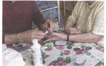
Le tribunal correctionnel rendra sa décision le 18 septembre prochain.

GIRONDE Deux infirmiers ont comparu hier devant le tribunal correctionnel, soupçonnés d'une fraude à l'assurance-maladie de plus de 1 million. Page 7