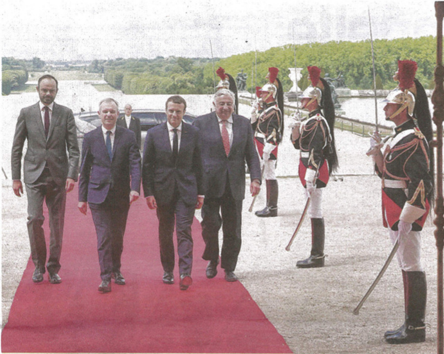
Hier à Versailles, le chef de l'État a été accueilli par son Premier ministre, Édouard Philippe, François de Rugy, président de l'Assemblée (tous deux à gauche du président), et Gérard Larcher, président du Sénat.