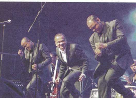
Yuri Buenaventura sera sur scène avec 11 musiciens. Il retournera ensuite en Colombie pour préparer son nouvel album.